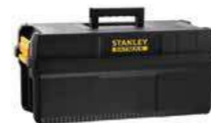
Caja 25" IP54 y asa ergonómica