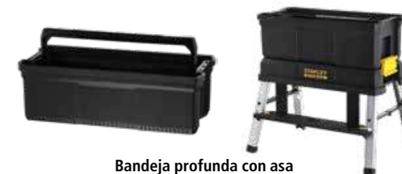
Bandeja profunda con asa Cierres laterales para asegurar al elevador