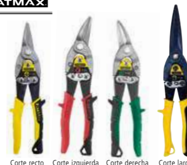
Corte recto Corte izquierda Corte derecha Corte largo