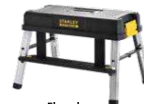
Elevador 150kg de capacidad máxima