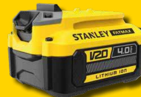
Batería V20 de 4Ah, valorada en 79€

POR LA COMPRA DE UNA HERRAMIENTA ELÉCTRICA O JARDÍN V20